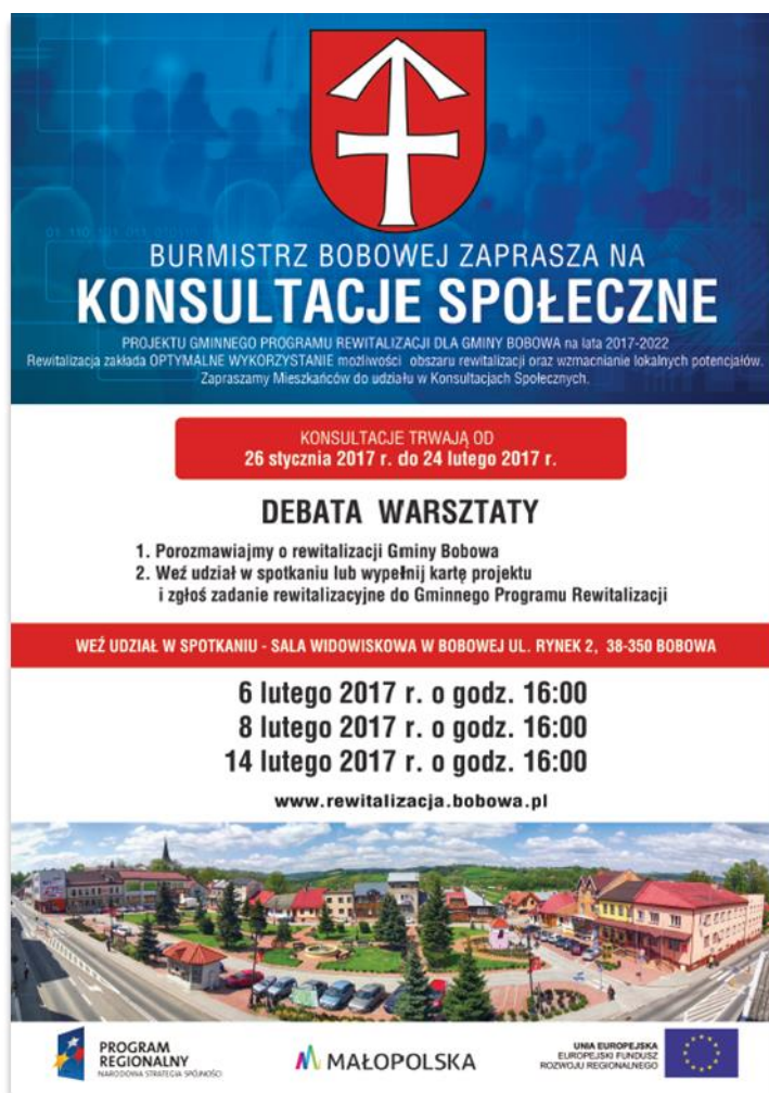
Rysunek 2. Plakat informacyjny

Projekt Gminnego Programu Rewitalizacji Gminy Bobowa na lata 2017-2022, ankieta oraz formularz konsultacyjny dostępne były: