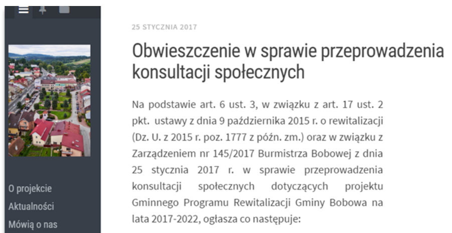
Rysunek 1. Fragment strony www gminy Bobowa z informacją o konsultacjach społecznych